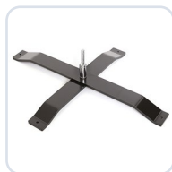
Kryssfot utomhus XL