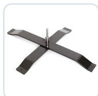
Kryssfot utomhus XL